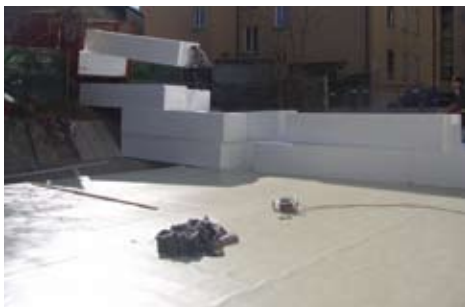
Abladen der SAGEX EPS Rohblöcke auf die Tiefgaragendecke, die mit wasserdichter Sarnafilfolie abgedeckt ist.

*Bis zu einer Höhe von 3 m sind SAGEX Blöcke mit einer Rohdichte von 15 kg/m 3 üblich. Bei grösserer Höhe oder bei Sitz- und Spielplätzen müssen SAGEX Blöcke mit 20 kg/m 3 Raumgewicht verwendet werden.