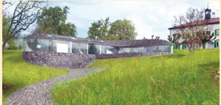
Sanft eingebettet im Grünen – das neue EFH mit dem markanten Kieselsteindach und der Glasfassade.

Die Villa von Cudrefin, ein ganz besonderes und sehr spezielles Haus, ein Steinhaus, das man nicht alle Tage in der Schweizer Baulandschaft sieht. Die unvergleichliche, geschwungene Form und die Materialien des EFH sind einzigartig. Wie eine Welle aus Stein und Glas fügt sich der Neubau in die leichte Hanglage ein. Die Kombination von Waschbeton, Kieselsteildach und Glasfassade wirkt sehr modern in der sonst ländlich geprägten Gemeinde oberhalb des Neuenburgersees.