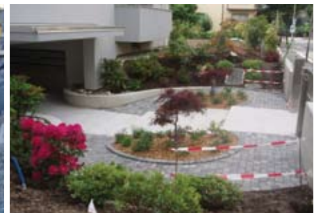
Wohlgestaltete fast fertige Eingangspartie, die sich sehen lässt.