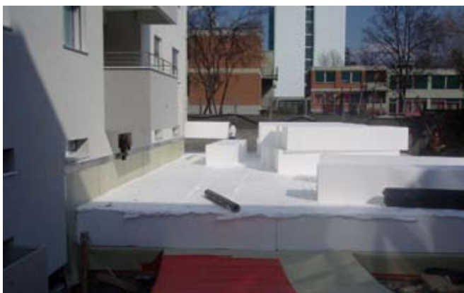
Verlegte SAGEX 15 Rohblöcke (Spezialzuschnitt 4060 x 1030 x 750 mm) als Füllkörper über der Tiefgaragendecke. Die Blöcke (105 Stück) sind alle mit einem weissen Schutzvlies abgedeckt. Dank der hohen Druck-, Biege- und Schubfestigkeit der SAGEX Blöcke wird eine gleichmässige Verteilung der anfallenden Lasten gewährleistet.