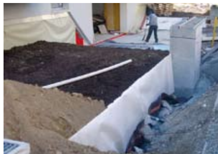
Zudecken der Blöcke mit Schutzvlies (auch seitlich), Schotter und Humus.