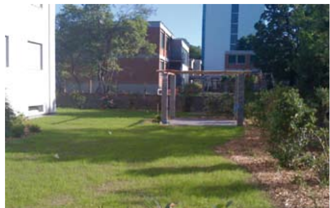
Ein perfekt von unten „gedämmter“ Garten mit bereits wachsendem Rasen und Sitzplatz mit Pergola. Die Überdeckung mit Erdmaterial sollte mind. 50 cm betragen. Nicht nur im Garten- und Landschaftsbau, sondern auch im Strassen-, Gelände- und Böschungsbau wird SAGEX schon seit Jahren erfolgreich eingesetzt.

Gartenbau Benicchio Giardini SA CH - 6814 Lamone