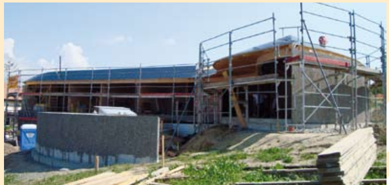
Ansicht des Rohbaus – zusammentreffen von Glasfront und der Steinfassade auf der Rückseite.

Die langgezogene First- und Fusspfette (je 2 Stück) aus verleimten BSH bilden das Kernstück der Konstruktion. Auf der Rückseite liegen die Sparren auf Montage-/Auflagewinkeln. Nach dem Überdecken der Pfetten mit einer Anschlussbahn und dem Zudecken mit OSB-Platten erfolgte das Ausdämmen im Innern mit den SAGLAN SR 40 Sparrendämmplatten.